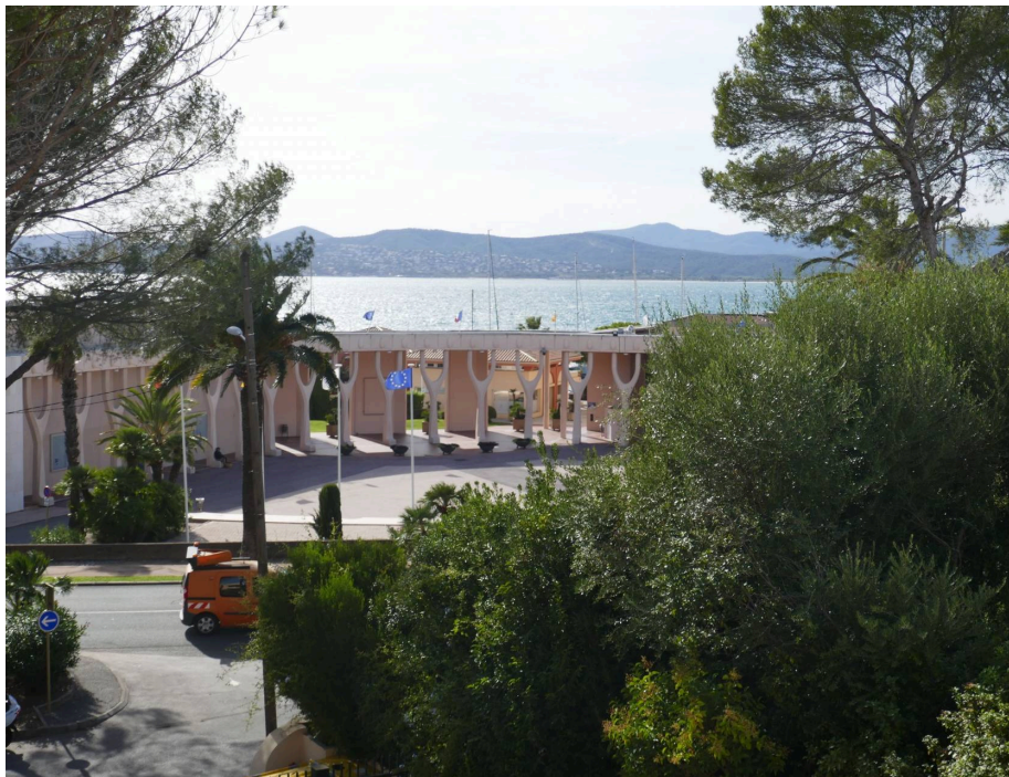
Appartement,f2,Terrasse,Vue Mer, Saint Raphael Santa Lucia,83700,Var.

Honoraires : 24 000 € , Montant net vendeur : 160 000 €