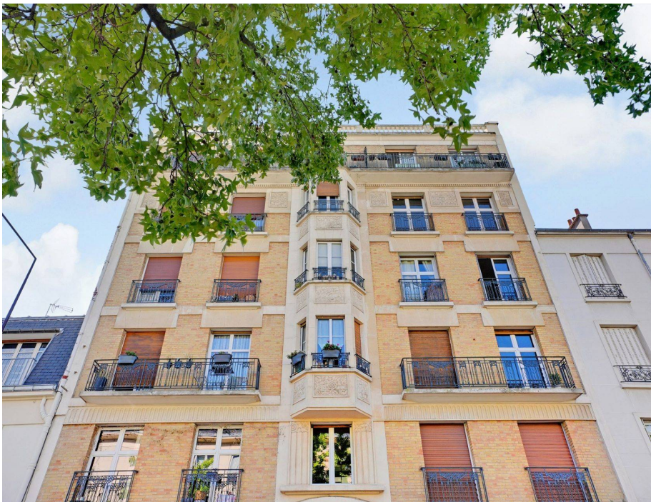
Appartement,f2,Charenton Le Pont,94220,Val de Marne.

Honoraires : 28 800 € , Montant net vendeur : 100 000 € €