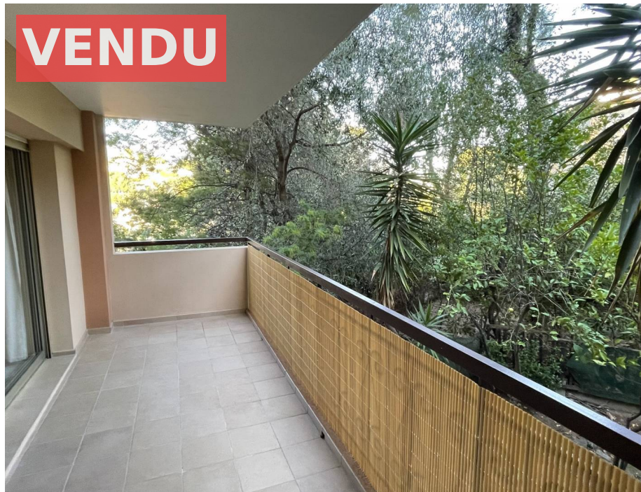
Appartement,f2,Roquebrune Cap Martin,06190,Alpes Maritime

Honoraires acheteur Honoraires : 9 990 € , Montant net vendeur : 0 €