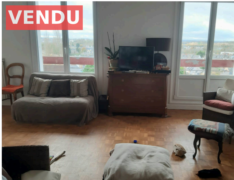
Appartement,f5,St Brieuc,22000,Cotes d'Armor.

Honoraires : 9 990 € , Montant net vendeur : 0 €