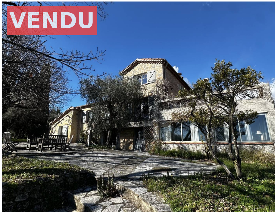
Villa,f8,345 M2,Dépendances,Opio,06650,Alpes maritimes

Honoraires : 120 000 € , Montant net vendeur : 50 000 € €