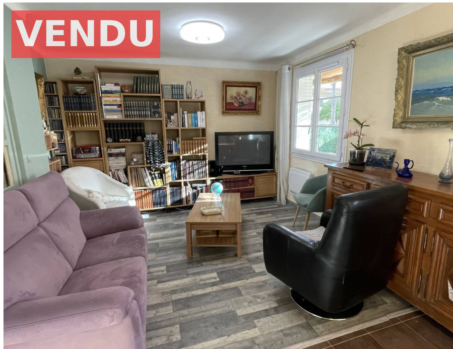
Appartement, f4, Six fours les Plages, Var 83140

Honoraires acheteur Honoraires : 19 990 € , Montant net vendeur : 0 €