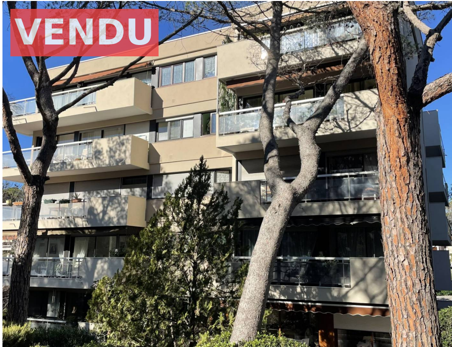
Appartement, f5, St Raphael, 83700, Var

Honoraires acheteur Honoraires : 38 400 €, Montant net vendeur : 0 €