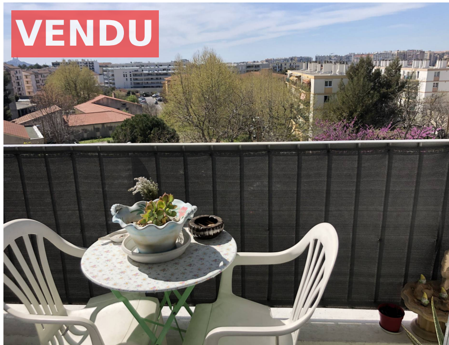
Appartement,f2,Marseille 13004,Secteur Montolivet.

Honoraires : 7 000 € , Montant net vendeur : 20 000 € €