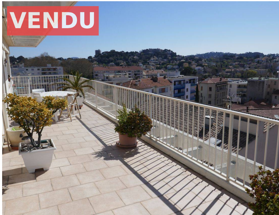
Appartement f2 à st Jean Du Var avec Terrasse de 80 M2 ,Toulon,83100,Var.

Viager Occupé, Mr de 75 ans et Dame de 78 ans.