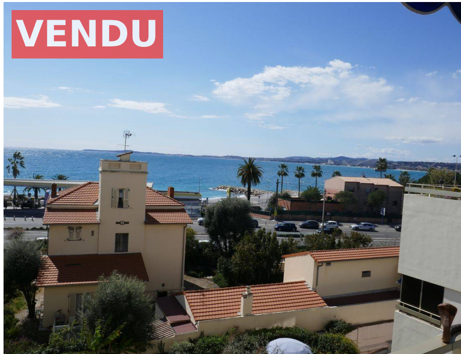
Studio avec Terrasse et Parking Vue Mer, Cagnes Sur Mer, 06800, Alpes Maritimes.