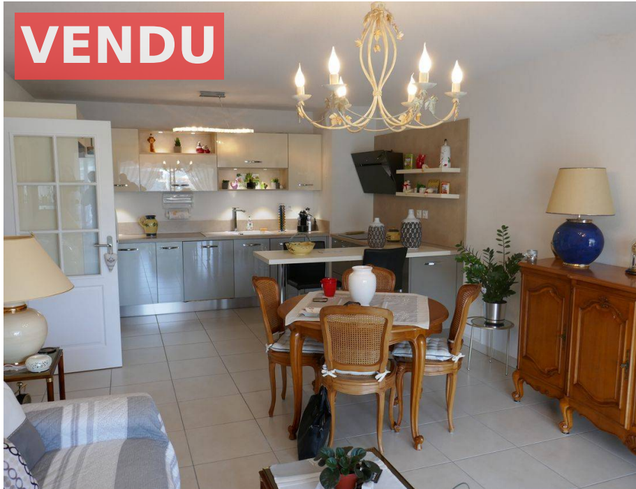
Appartement f3,Saint Raphael,83,Var.