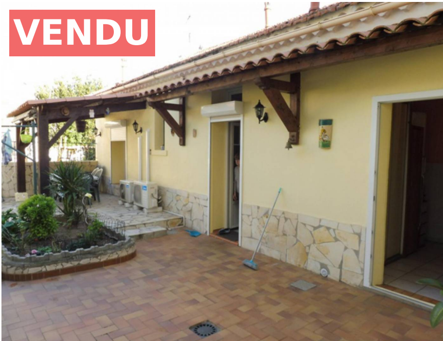
Villa, f4, Toulon, Pont du Las, 83200, Var

Viager Occupé, 80 et 74 ans. Bouquet : 29990€, Rente : 400€, Valeur Vénale : 210000€