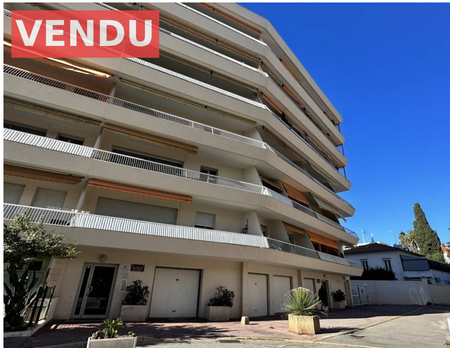
Appartement,f2, Cagnes sur Mer, 06800 ,Alpes Maritimes

Honoraires : 19 900 € , Montant net vendeur : 30 000 € €