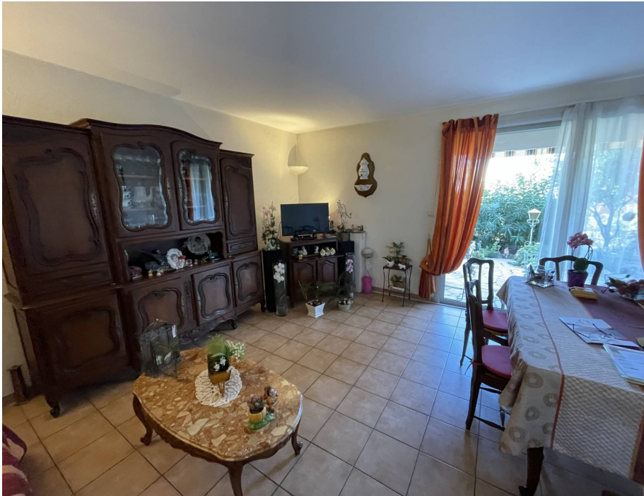
Appartement, f3, St Laurent du Var, 06700, Alpes Maritimes.

Honoraires : 19 000 €, Montant net vendeur : 100 000 € €